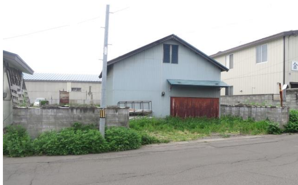
建物は売主が解体のうえ引渡します。